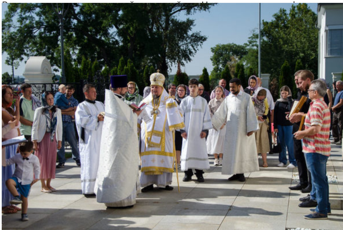
о собора о святом

Во дворе храма у памятника павшим советским воинам духовенство и молящиеся пропели «Вечную память».