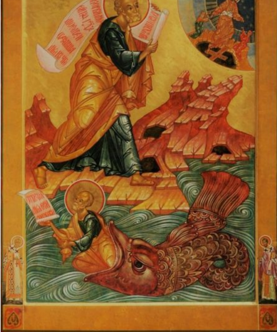
Kisha Orthodoxke Autoqefale e Shqipërisë