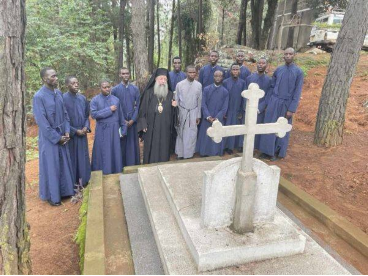
رصم (اطنط) سيلوبومرا ةينارطم