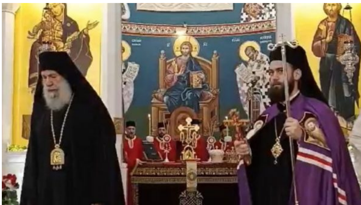
Свети великомученик Димитрије