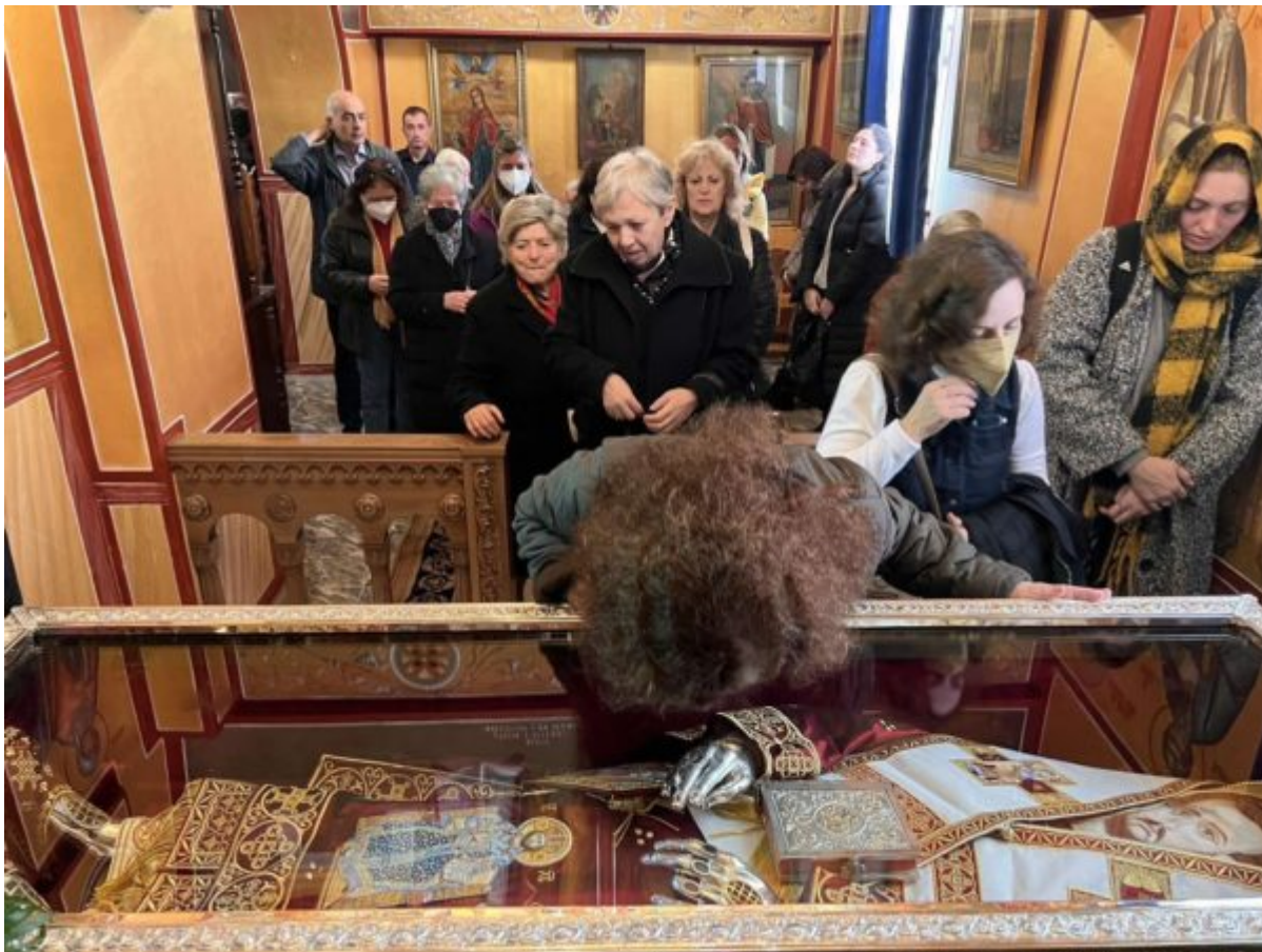
Αγρυπνία, του Αγίου

Στην ομιλία του ο Σεβασμιώτατος αναφέρθηκε στο Ευαγγελικό Ανάγνωσμα της ημέρας (Μαρκ. β', 23-γ', 5), καθώς και στα πνευματικά χαρίσματα του Επισκόπου Αγίου Ελευθερίου, ο οποίος αποτελεί πνευματικό φάρο της τοπικής Εκκλησίας της Νέας Ιωνίας, καθώς στο πρόσωπό του συναντώνται η παράδοση, οι ρίζες και η βαθιά πίστη στον Τριαδικό Θεό.