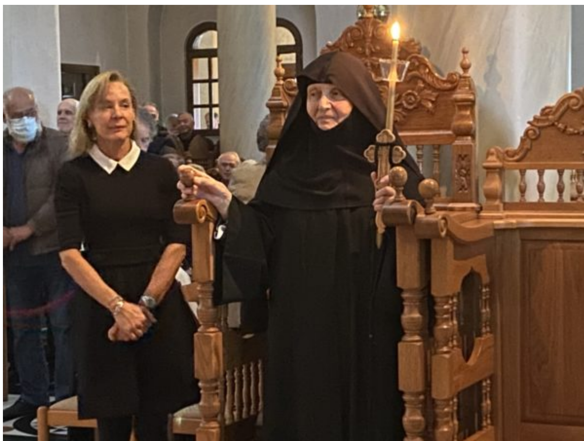
Τον Θείο Λόγο κήρυξε ο Γέροντας Εφραίμ, ο οποίος αναφέρθηκε στο σπουδαίο