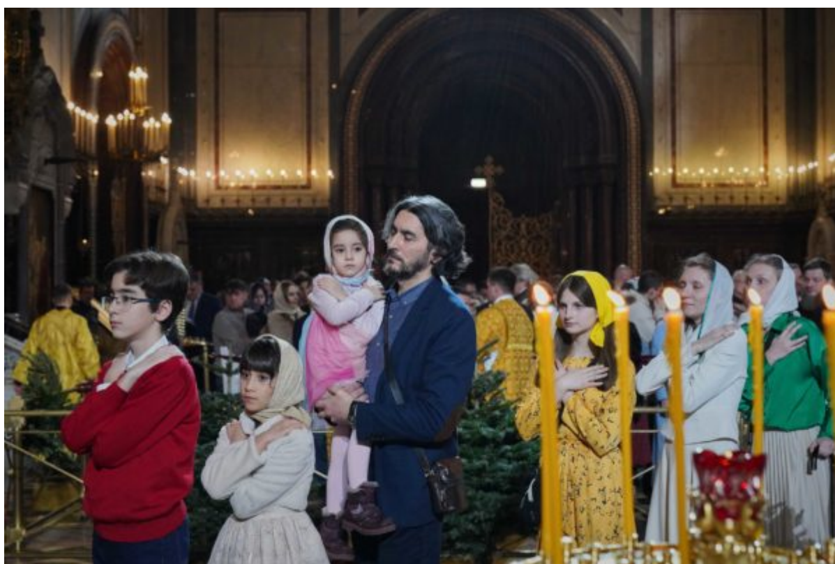
Фото: Сергей Власов Олег Варов