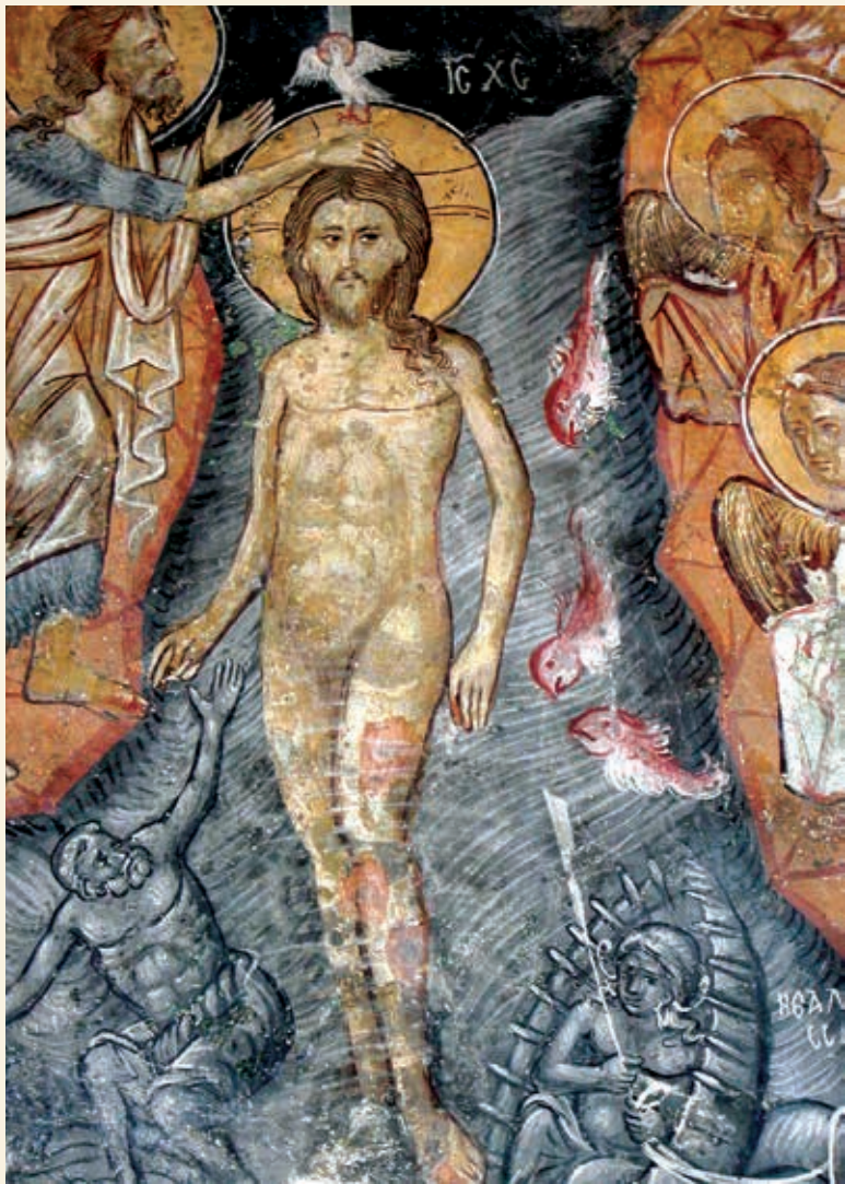
Τοιχογραφία από τον Ιερό Ναό Αγίας Παρασκευής Γεροσκήπτου, Πάφος