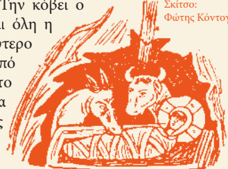
«ΘΕΟΣ ΕΦΑΝΕΡΩΘΗ ΕΝ ΣΑΡΚΙ» (ΤΙΜ. Α', 3.16).

Σε ό,τι αφορά στη βασιλόπιτα που ευλόγησε ο Αι-Βασίλης το βράδυ, την κόβουν την Πρωτοχρονιά, όταν θα γυρίσουν από την εκκλησία. Την κόβει ο νοικοκύρης όρθιος στο τραπέζι, όπου συγκεντρώνεται όλη η οικογένεια. Το πρώτο κομμάτι ανήκει στο Χριστό, το δεύτερο στην Παναγία, το επόμενο στα παιδιά (ξεκινώντας από το μεγαλύτερο), το προτελευταίο στη νοικοκυρά και το τελευταίο στο νοικοκύρη. Εκείνος που θα βρει το νόμισμα της βασιλόπιτας, που συμβολίζει το αγίο ψωμί της οικογένειας, θεωρείται και ο τυχερός της οικογένειας για όλη τη χρονιά.