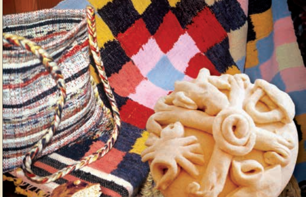
Υφαντό: Αρχείο ΚΟΤ

Σκίτσο: Κυπριακά Ταχυδρομεία, Άντης Ιωαννίδης - από αναμνηστική σειρά γραμματοσήμων.