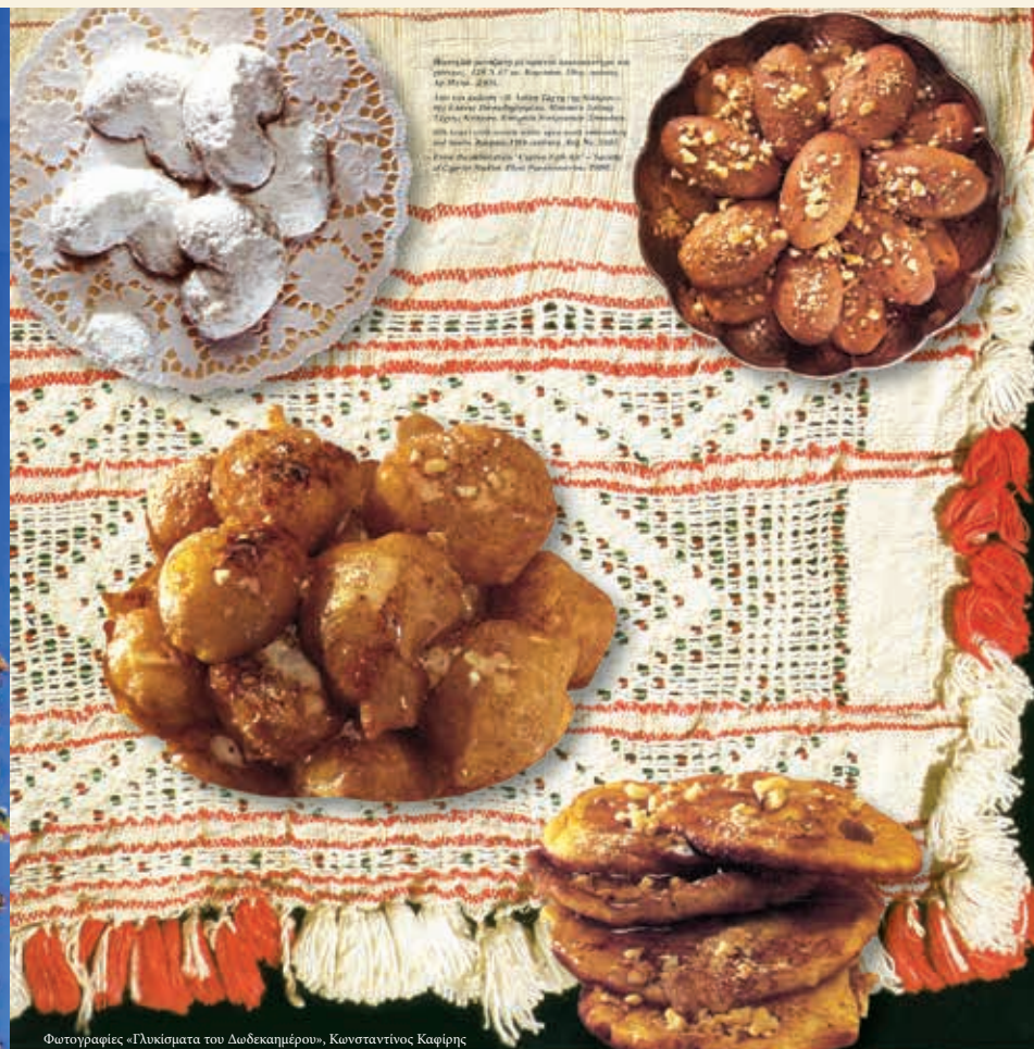
Φωτογραφίες «Γλυκίσματα του Δωδεκαημέρου», Κωνσταντίνος Καφίρης Από την έκδοση της Σιμόνης Καφίρη «Με αμύγδαλα, καρδιά και μέλι Ανθολόγιον Ελληνικών Γλυκών», εκδόσεις Ελληνικά Γράμματα, Αθήνα 2001.

ΤΑ ΕΘΡΑΣΤΙΚΑ ΓΛΥΚΙΣΜΑΤΑ ΤΟΥ ΔΩΔΕΚΑΗΜΕΡΟΥ «Τυλιχτά γλυκίσματα» που συμβολίζουν τον φασκιωμένο Χριστό»