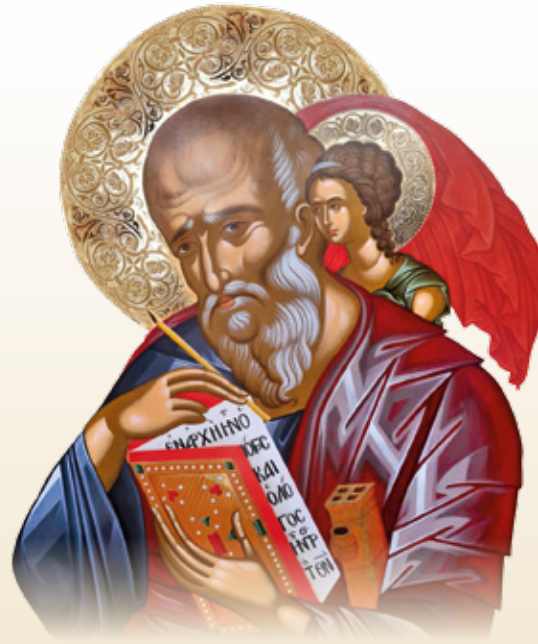
ΙΩΑΝΝΗΣ Ο ΘΕΟΛΟΓΟΣ