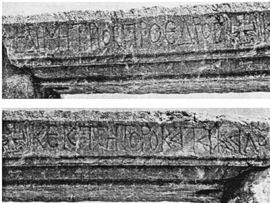
Εικ. 3. Κτητορική επιγραφή από τον ναό του Αγίου Νικολάου Υπάτης (Α. Ανταμέα – D. Feissel, 1987, αρ. 14, πίν. V, 1)