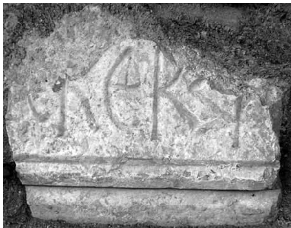
Εικ. 4. Επιγραφή από τον ναό της Αγίας Σοφίας Υπάτης