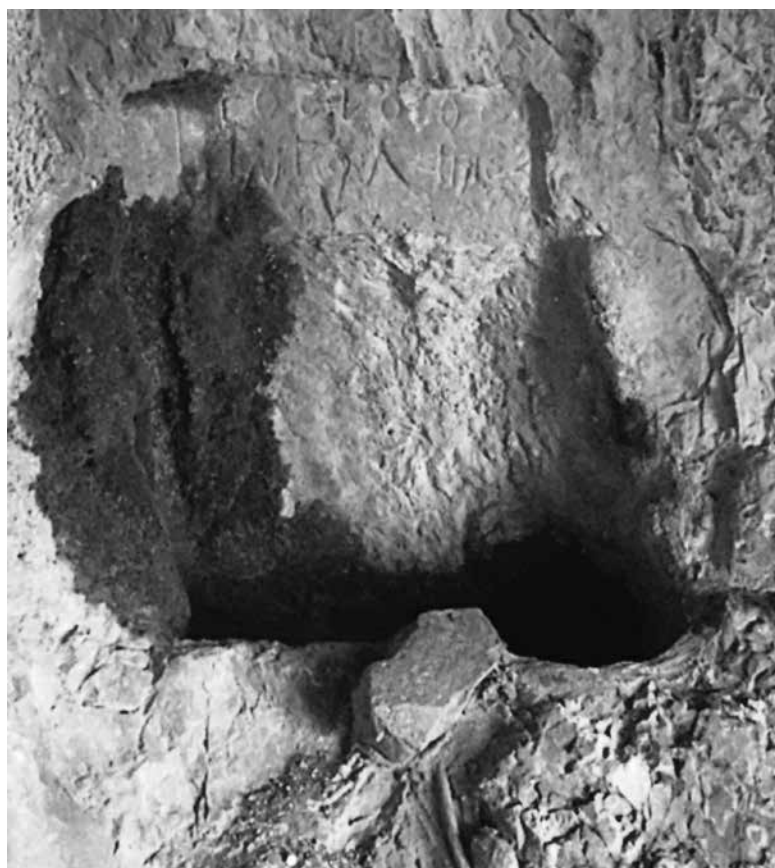
Ειγ. 2. Ο συλλεκτήρας νερού και η επιγραφή στο ανώτερο μέρος